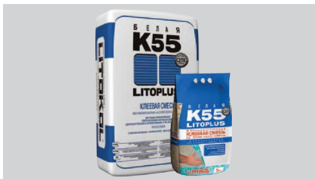
Мешки 25 кг трехслойные, из двух слоев бумаги с промежуточным слоем из полиэтиленовой пленки. Мешки 5 кг из металлизированной пленки.